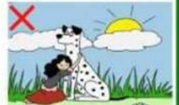
NE JAMAIS ENLACER OU IMMOBILISER UN CHIEN