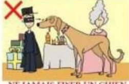
NE JAMAIS FIXER UN CHIEN DANS LES YEUX