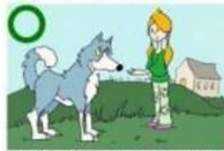
LAISSER LE CHIEN RENIFLER SA MAIN EN LUI PROPOSANT