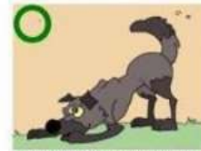
ON PEUT APPROCHER UN CHIEN QUI APPELLE AU JEU