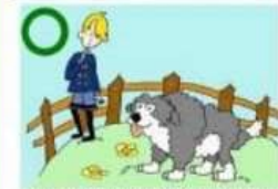
APPROCHER EN TOURNANT AUTOUR DU CHIEN