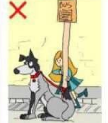
NE JAMAIS APPROCHER UN CHIEN ATTACHÉ