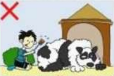
NE JAMAIS DÉRANGER UN CHIEN QUI SE REPOSE