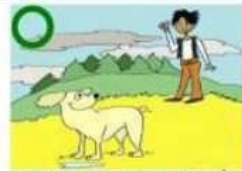
APPELER LE CHIEN PLUTÔT QUE L'APPROCHER