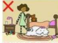
NE JAMAIS FRAPPER UN CHIEN