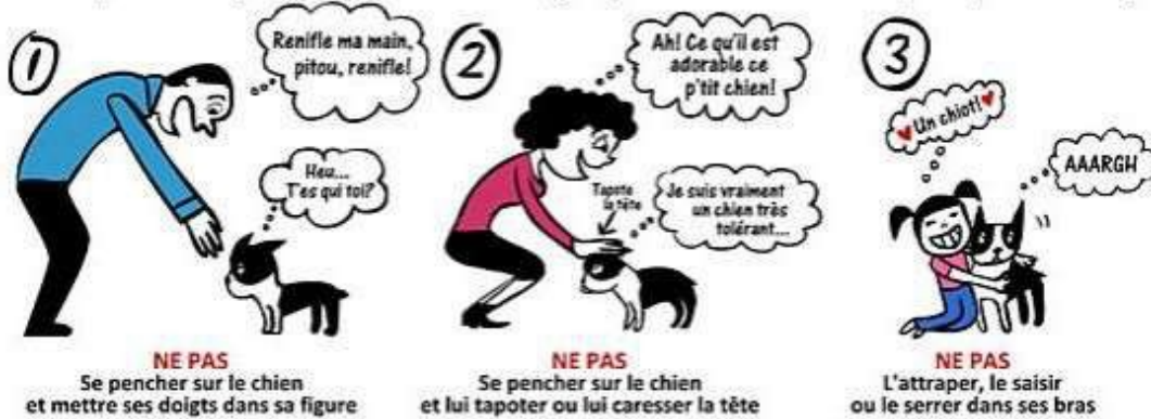
NE PAS Se pencher sur le chien et mettre ses doigts dans sa figure

La plupart des gens agissent tel qu'illustré ci-dessous, ce qui stresse le chien et peut l'amener à MORDRE. Autant vous (ou votre enfant) trouvez mon chien mignon, autant vous devez le respecter, lui et son espace.