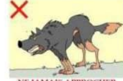
NE JAMAIS APPROCHER UN CHIEN AGRESSIF