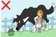
NE JAMAIS APPROCHER UN CHIEN QUI MANGE

Dans la plupart des cas, l'enfant n'est pas capable de comprendre ces règles en dessous d'un certain âge, c'est donc aux parents qu'incombe la responsabilité de les faire respecter.