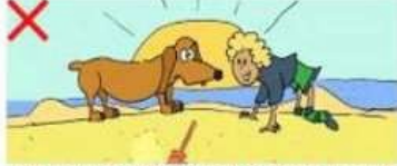
NE JAMAIS APPROCHER SON VISAGE DE LA TÊTE D'UN CHIEN