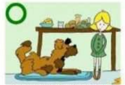
DETOURNER LE REGARD POUR APAISER LE CHIEN