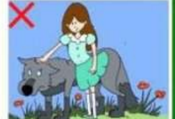
NE JAMAIS POSER SA MAIN SUR LA TÊTE D'UN CHIEN INCONNU

Dessins : Eilina O'Brien ( http://aisling.e-mona.ie/ ) - Textes : Raphaël Pin ( http://diouk.canalblog.com/ ) - D'un Coeur à l'Autre - Un coeur sur Pattes - Border collie passion