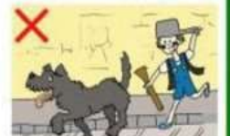
NE JAMAIS COURIR APRÈS UN CHIEN