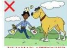
NE JAMAIS APPROCHER UN CHIEN EN COURANT